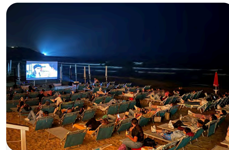
Serate a tema