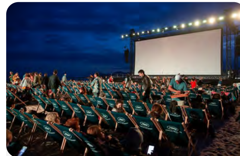
Cinema in spiaggia

Qui alcuni degli eventi autorizzabili con la Licenza: