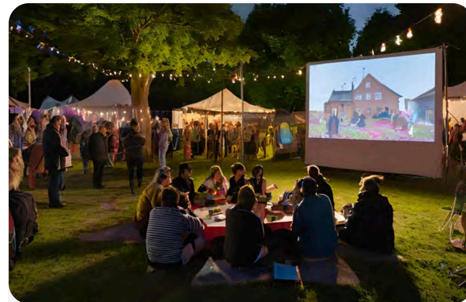
Proiezioni in fiere o sagre