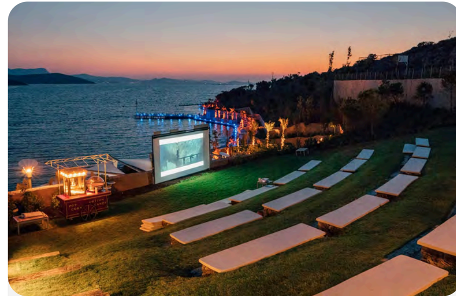
Cinema sotto le stelle

I principali eventi organizzati in questa stagione sono: