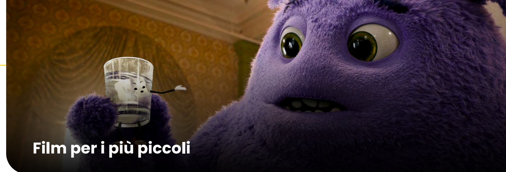
Film per i più piccoli

È possibile usufruire del servizio di assistenza alla programmazione : un consulente dedicato fornirà il supporto necessario dalla scelta dei titoli fino alla conclusione dell'evento.