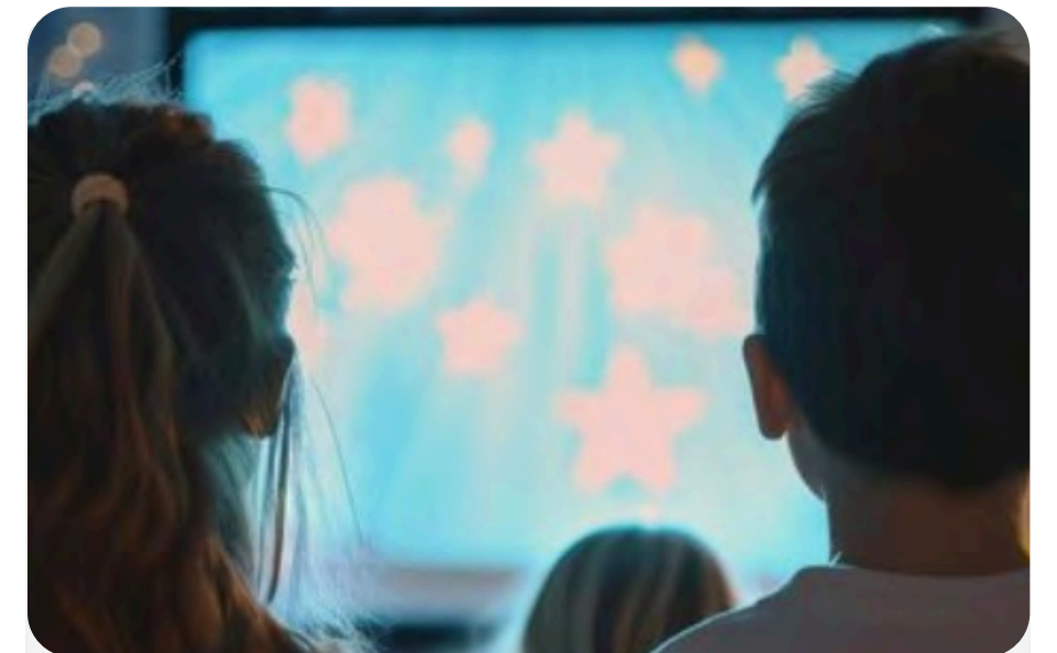
Intrattenimento per bambini