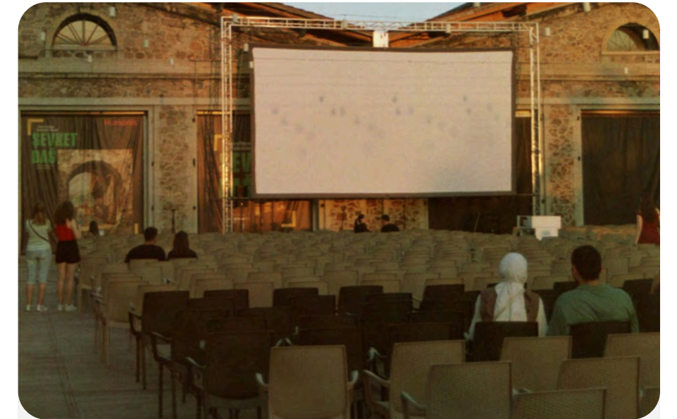
Film in piazza